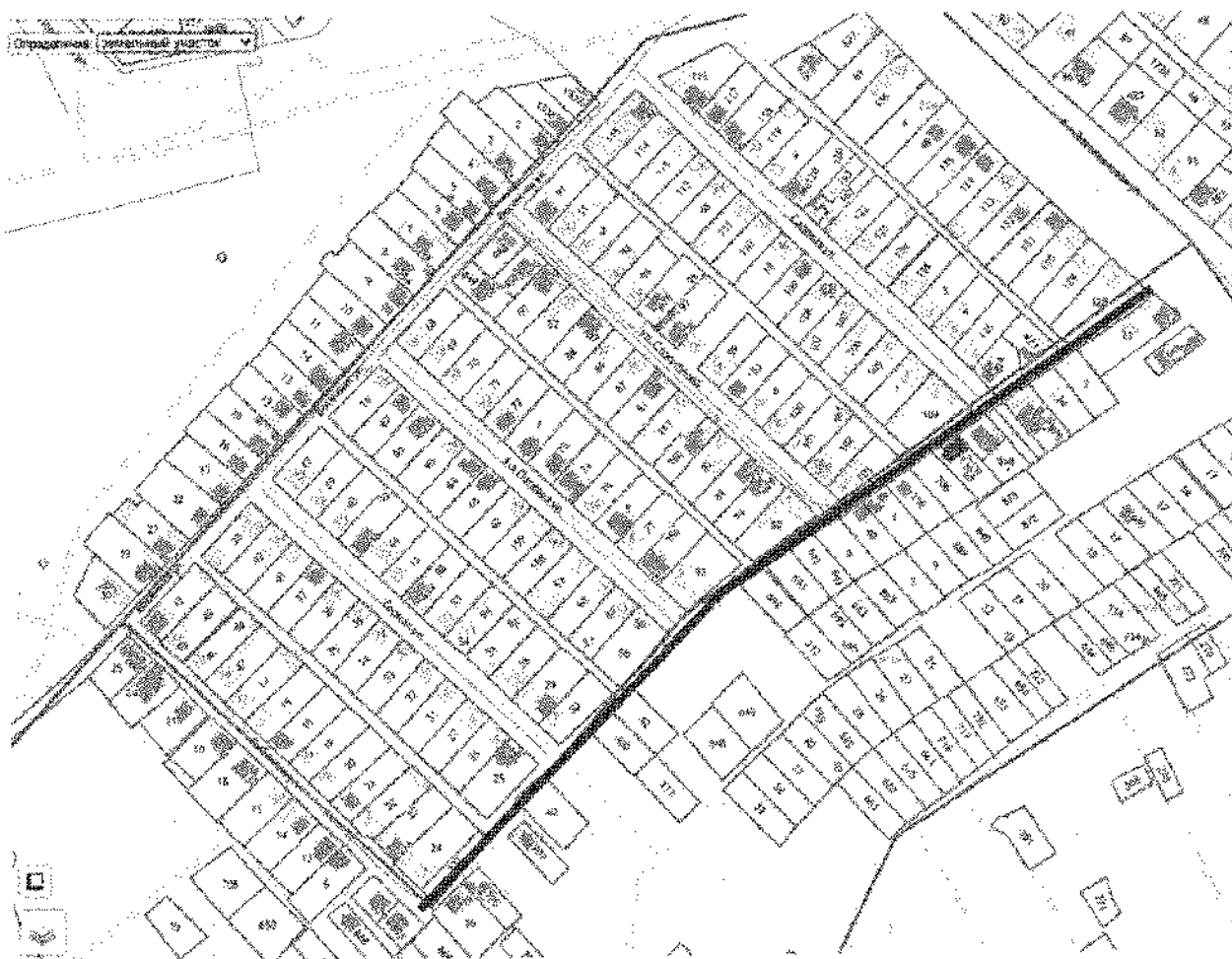
Схема расположения улицы Кузьмы Сарычева